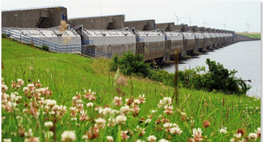
La diga di protezione contro le mareggiate di Haringvliet verrà aperta periodicamente per permettere ai pesci migratori di tornare a nuotare liberamente verso monte.

Detto ciò, prima della fine di quest'anno si è portata a casa un'importante vittoria di tappa: situata a sud di Rotterdam, la diga di protezione contro le mareggiate di Harlingvliet verrà aperta periodicamente. I salmoni e gli altri pesci migratori ne trarranno un gran beneficio, dato che nelle strette vicinanze di Harlingvliet si situa la foce di uno dei tre bracci del Reno, dove si getta nel Mare del Nord. Finora, questa diga ha fortemente ostacolato la migrazione di ritorno dei salmoni nel delta del Reno. Quest'apertura parziale aumenta le chance che i salmoni e gli altri pesci migratori trovino l'entrata verso il bacino imbrifero del Reno.