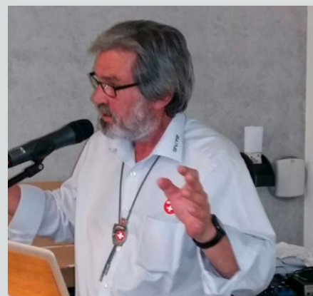
Roberto Zanetti ha diretto l'AD.