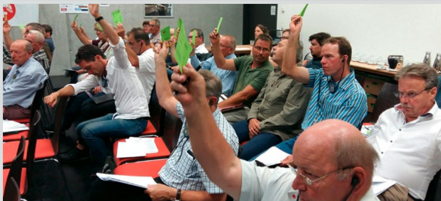
I delegati hanno votato sulle trattande attuali.